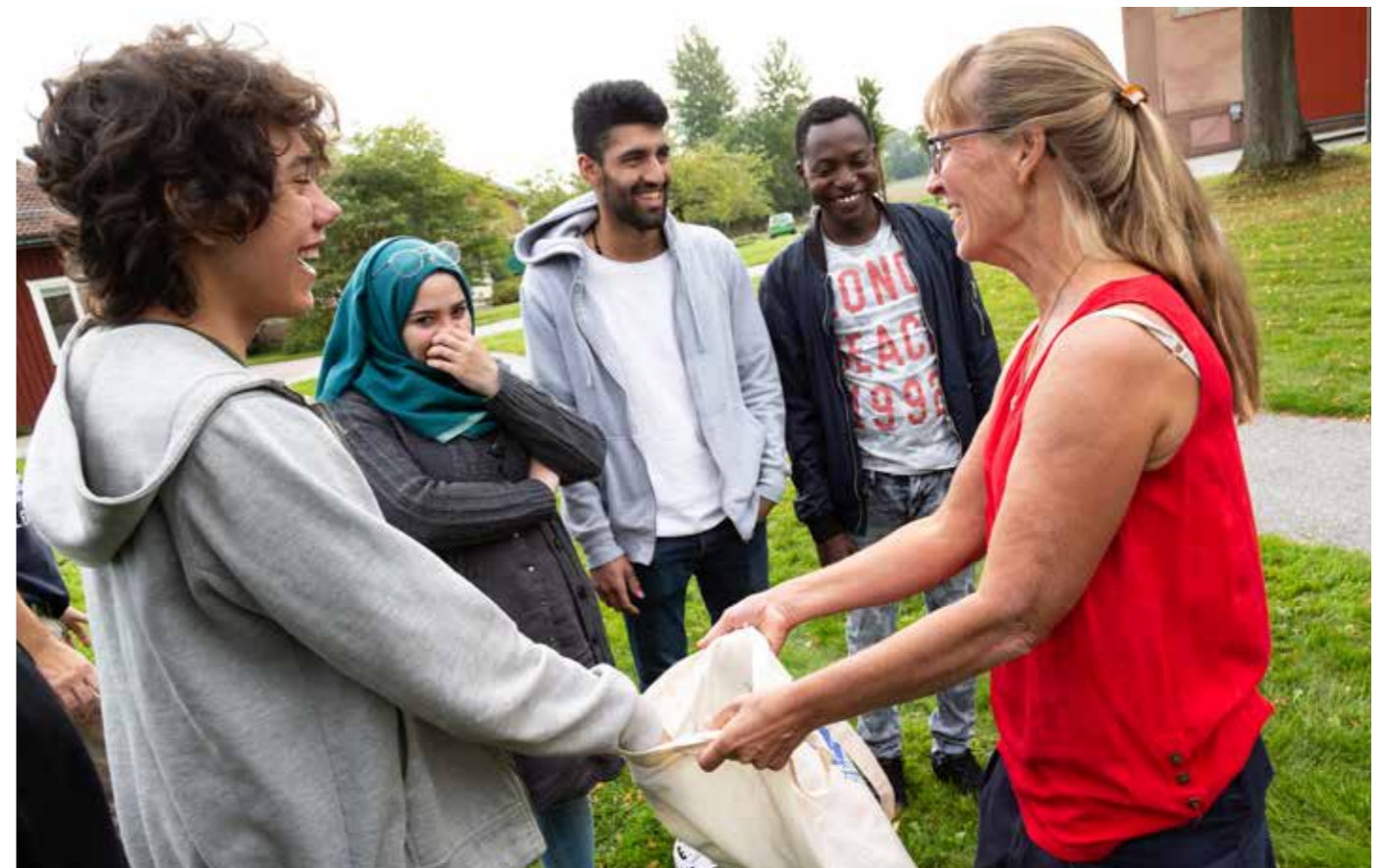
Allmän kurs har gruppstärkande samarbetsövningar, 2018.