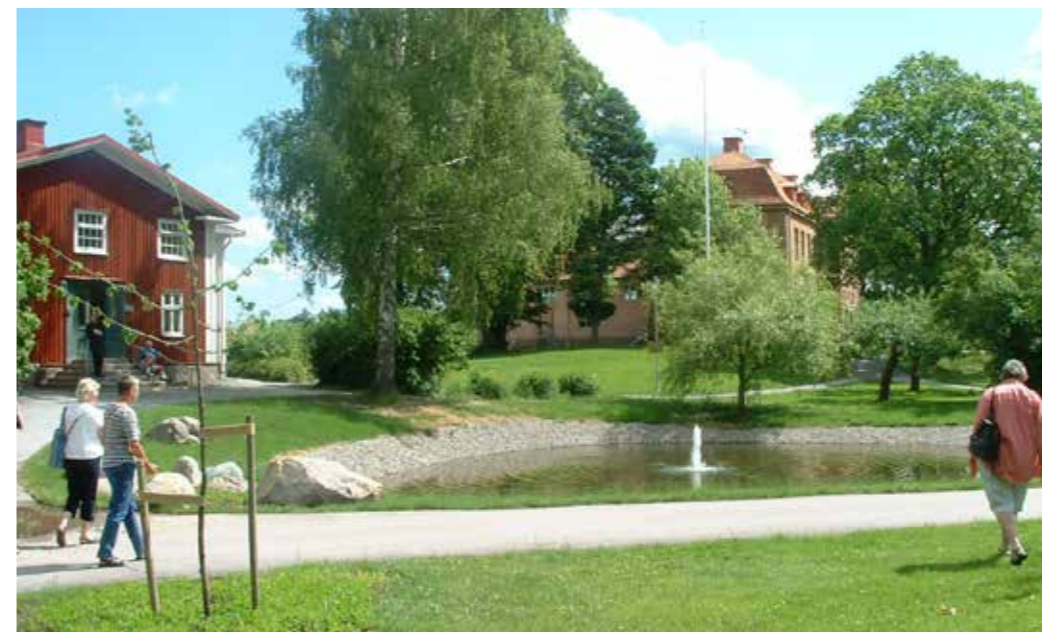
Sommarkursvecka på Kävesta 2002.