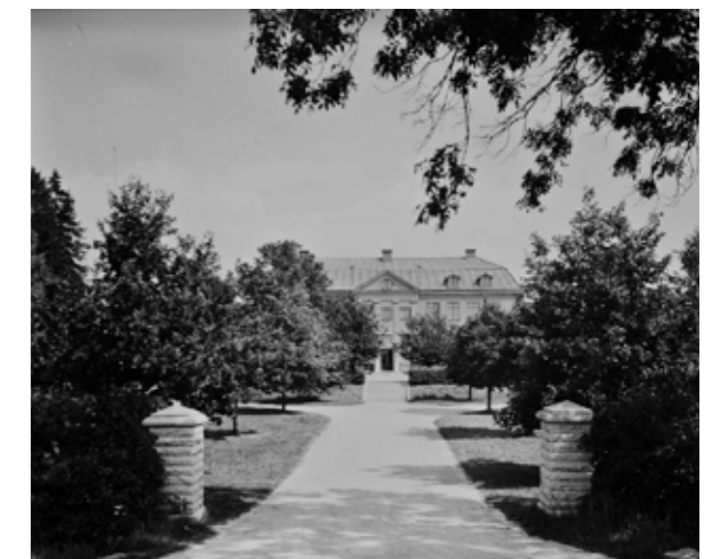
1926 byggdes ett nytt skolhus, här på foto från 1930-talet.