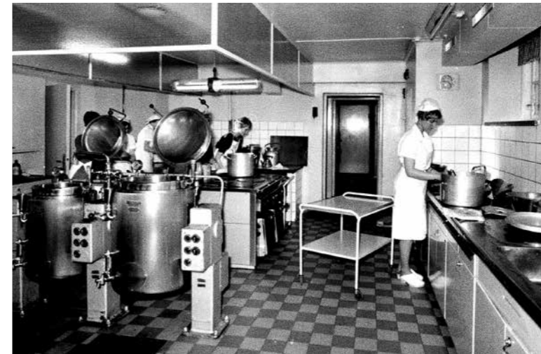
Köket när det låg i huvudbyggnadens källare.