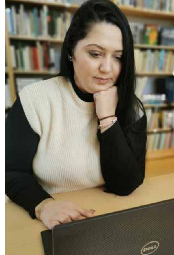
Efter erfarenheter från pandemin erbjöds Allmän kurs för första gången helt på distans 2023.

Idag, november 2023, har Kävesta 176 deltagare, varav 69 på internatet. Allmänna kursen samlar 85 deltagare, varav 20 på distans. Av de övriga linjerna är musiken störst med 40 deltagare. Konst och formgivning har 34 och danslinjen 17. Skolan fortsätter att vara en plats för bildning och demokrati, där människor kan växa utifrån egna förutsättningar. Den är ett kulturcentrum under ständig utveckling för bygden och hela länet. Man står väl rustad inför framtiden.