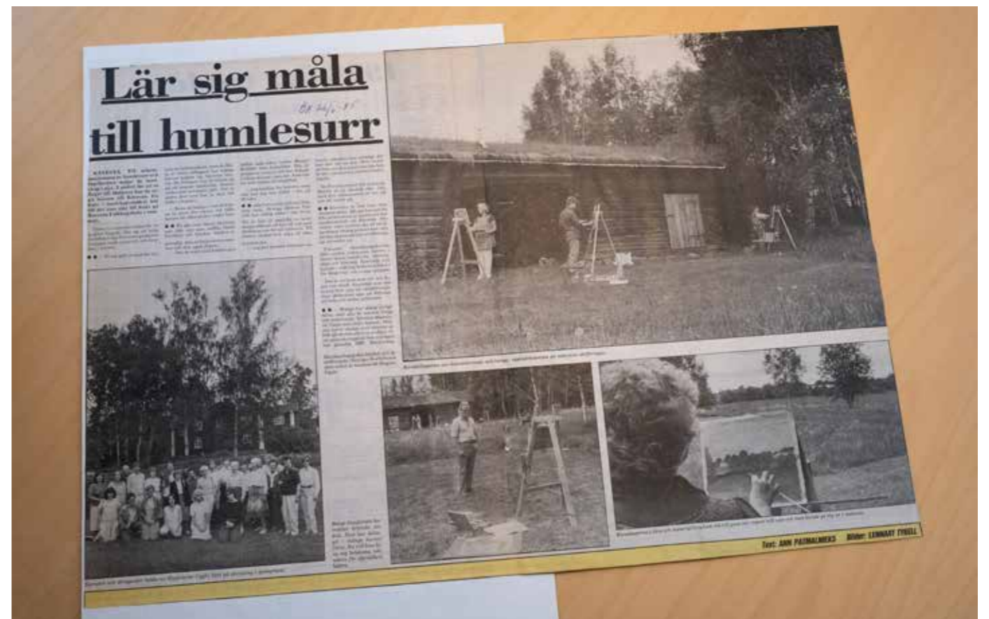
Örebrokuriren besökte Kävestas sommarkurser i juni 1985.