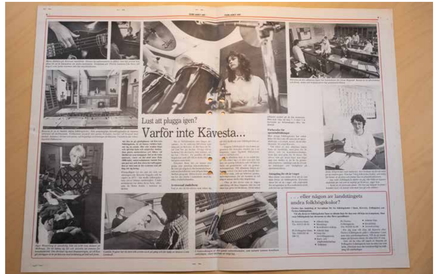
Örebro läns landstings tidning Tebladet gjorde ett uppslag om Kävesta folkhögskolas kurser i nr 3 1987.

Frågan om folkhögskolornas huvudmannaskap blev åter aktuell. En utredning från 1987 föreslog att Fellingsbro skulle få facklig huvudman och Örebro en stiftelse med idrottsrörelsen, NBV och landstinget som huvudman. För Kävesta fanns ingen särskild folkrörelse kopplad till skolans profil, så här föreslogs en självständig stiftelse med landstinget som huvudintressent. Som alternativ föreslogs Örebromissionen som var intresserad av en skola i länet. Skolans styrelse förordade alternativet landstingsstiftelse. Det blev dock inget beslut om förändringar. Landstinget valde att avvakta den pågående statliga utredningen om folkhögskolans framtid.