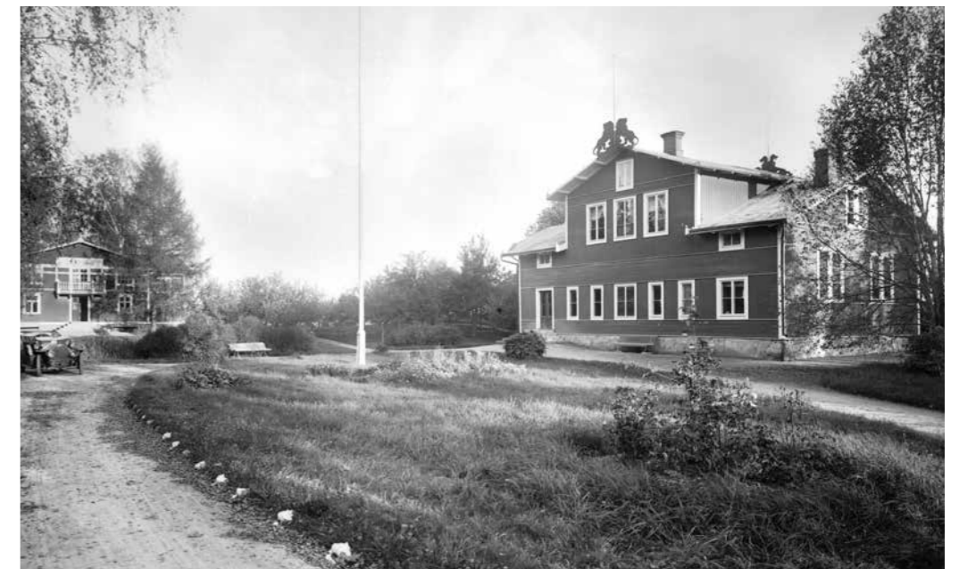
Det första skolhuset började byggas på Vrana gård, men förflyttades sedan till den nyligen köpta marken i Kävesta. Huset togs i bruk 1878 och används fortfarande vid undervisning.