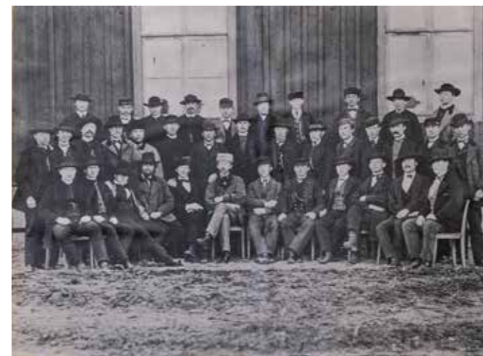
Deltagare vid den första vinterkursen på Vrana gård, 1873. Fotograf okänt. Fotokopia från tavla i skolmuseet.