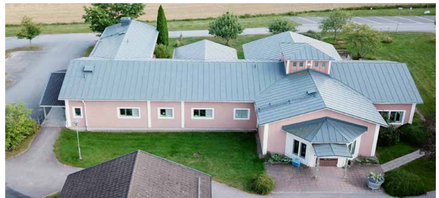
Nuvarande matsalsbyggnad.