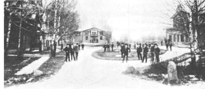
Runt Kävestas damm uppfördes skolhuset 1878 (till höger), rektorsbostaden 1889 (till vänster) och gymnastiksalen 1896 (rakt fram). Dessa byggnader utgör en av de bäst bevarade folkhögskolemiljöerna från denna tid. Fotograf och datum okänt. Kopia ur boken "Kävesta folkhögskola hundra år och lite till."

Under alla år har miljön på Kävesta utvecklats genom tillkomsten av nya byggnader, när behov funnits. Vid förra sekelskiftet hade skolhuset kompletterats med rektorsbostad och en gymnastik- och högtidssal. Därefter följde det första stora elevhemmet med flyglar som stod klara 1907. Intilliggande Nybble gård inköptes för lantbruksundervisningen. Det innebar stora ekonomiska påfrestningar för folkhögskoleföreningen och när det stora skolhuset byggdes på 20-talet var det landstinget som stod för kostnaderna. Det ledde till att föreningen och landstinget bildade en gemensam stiftelse 1931, som drev skolan till 1955, då landstinget blev ensam huvudman. Stiftelsen ansågs då vara ett onödigt mellanled mellan landstinget och skolan. Under 40-talet tillkom ytterligare ett elevhem och därefter två lärarbostäder samt en naturvetenskaplig paviljong.