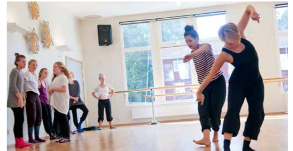
Lektion i den nya danssalen.