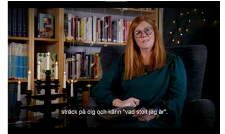
Digitala jul- och sommaravslutningar blev återkommande inslag under coronapandemin.