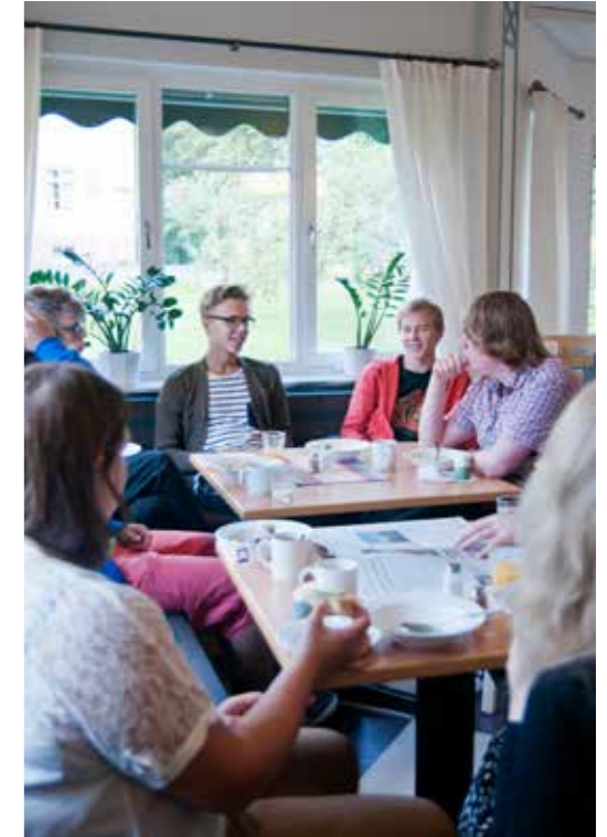
Nuvarande matsalen.