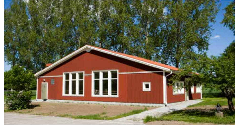
Danshuset, byggt 2005.

Nya krav ställdes från Folkbildningsrådet, landstinget och myndigheter på olika former av bland annat kvalitetsredovisning, miljöcertifiering, jämställdhetsplaner eller utarbetande av vision och värdegrund. Det innebar omfattande insatser för analys och dokumentation i syfte att utveckla och kvalitetssäkra verksamheten.